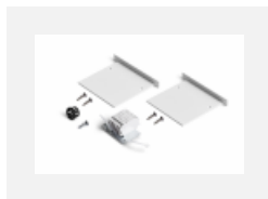
04-00101, W 2xkoncovka - kov, 5pól.svorkovnice, přůchodka