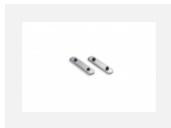
04-00200, N spoj přímý