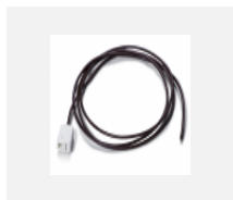
00-00500 vodič pro nouzové osvětlení XX- XXXX-20